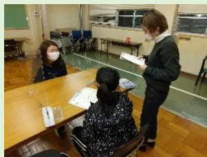
▲クラブの様子。センター3階にある多目的室で開催しているよ!

■放課後学びクラブ 中学生が大学生のお兄さん・お姉さんや地域の方と一緒に学習し、楽しく過ごせる居場所です。NPO法人3団体と連携を図り、毎週月・火・金曜日の午後4時〜8時に開催しています。興味のある方はぜひ!