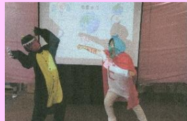
◀地球を守れアースマン(温暖化問題)

演目は現在19作にのぼり、パソコン紙芝居やパワーポイントでの説明を取り入れるものなどもあり、大人から子どもまで一緒に観て、笑って、考えることができるように工夫も凝らしています。